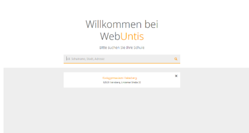
Abbildung 1 Schulsuche